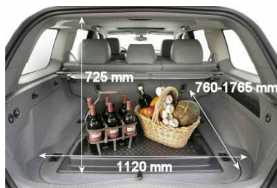
Mit nur 355 l Volumen ist der Kofferraum des Grand Cherokee nicht größer als bei einem VW Golf.