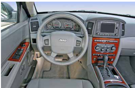
Sowohl die Funktionalität als auch die Verarbeitungsqualität haben noch kein Oberklasseniveau erreicht.